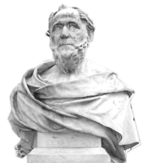
BI Treptower Park